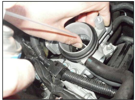
汚れをとってお車の調子を素早く回復！